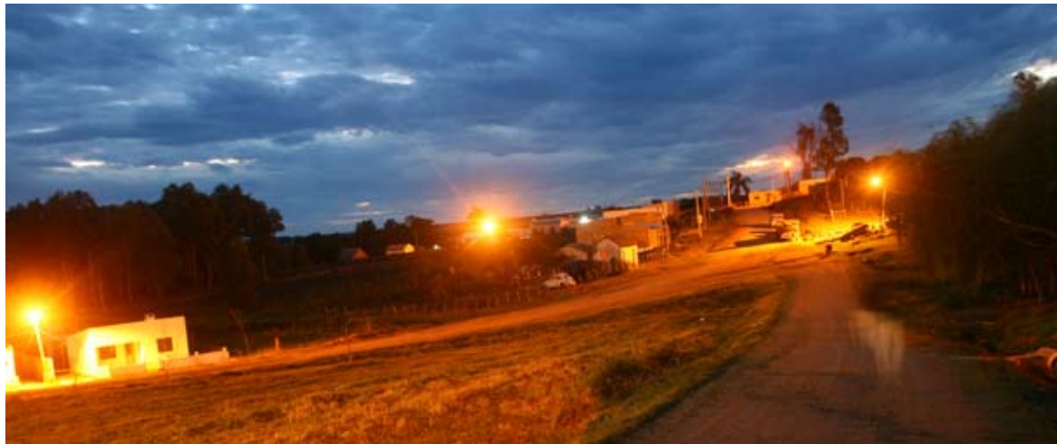
Noche en Villa Ansina, Tacuarembó.

A pocos kilómetros de Minas de Corrales se encuentran las ruinas de la represa hidroeléctrica de Cuñapirú, primera represa en todo el continente americano, que generó electricidad hasta 1916; en 1959, por efecto de las inundaciones se rompe su dique y es clausurada. Actualmente sus ruinas significan un importante punto turístico dentro del departamento de Rivera.