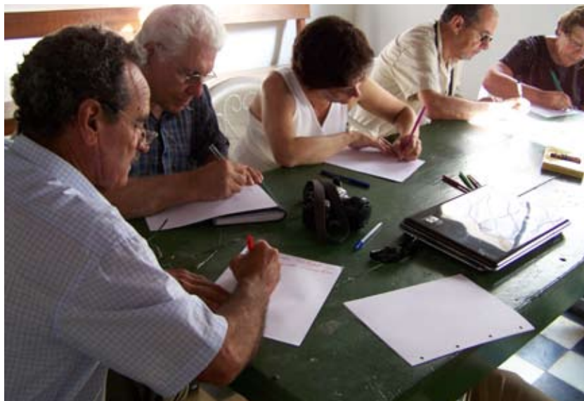
Dinámicas escritas en el video participativo. Minas de Corrales, Rivera.

Además, se pretende capacitar en la utilización de nuevos medios a personas con difícil acceso a estos recursos y elaborar un registro de pautas culturales que facilite la promoción del resto de las acciones de organización social y participación democrática de la ciudadanía. Se recogerá la historia oral, musical, saberes y oficios hoy en desaparición, prácticas culturales que hacen a la identidad local regional.