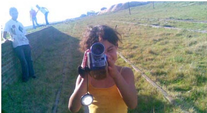
Joven realizando tomas del Video participativo. Valentines, Treinta y Tres.

Valentines. Se llevó a cabo una serie de talleres de video a lo largo de dos meses, con una frecuencia semanal. El producto de tales talleres refiere a la elaboración de un corto, que se exhibió a todo el pueblo el 19 de noviembre de 2009 en el predio donde está ubicado el Monumento Comunitario. Paralelamente se hizo entrega de certificados a todos los participantes del taller.