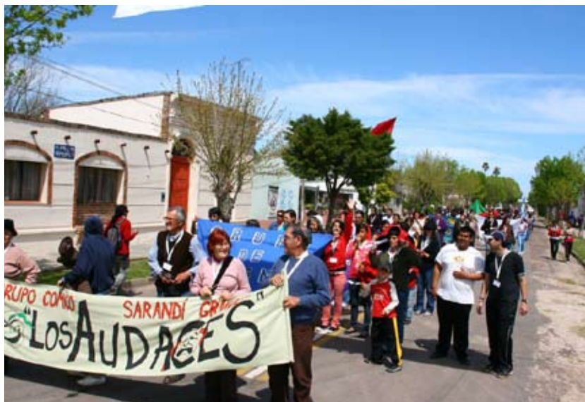
Desfile de varios pueblos en el encuentro nacional. Villa Soriano, Soriano .

Acerca de los productos esperados, los encuentros regionales y nacionales procuran efectuar eventos anuales con gestión comunitaria,