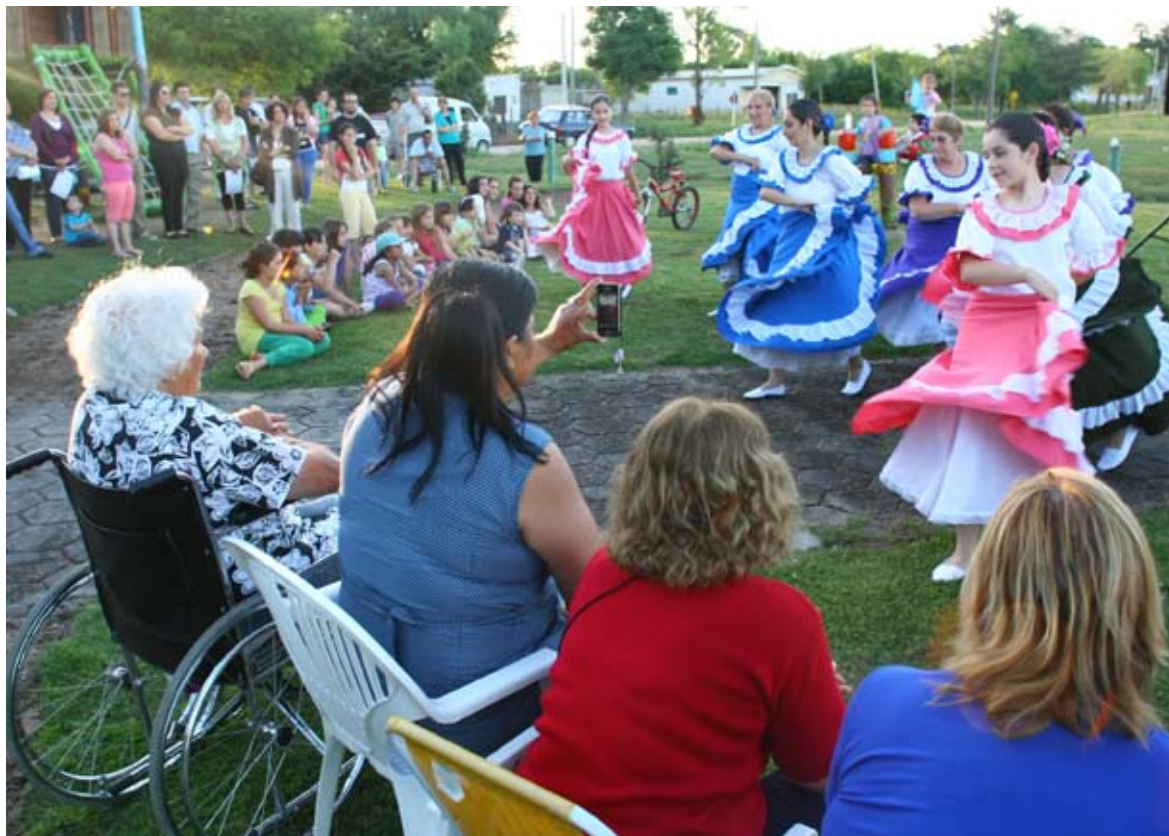
Fiesta de inauguración del monumento en Sarandi Grande.

cuna de grandes campeones en esta disciplina a lo largo de su historia. Esto se evidencia en todas las reuniones mantenidas tanto con adultos como con niños, y por esto la elección de la temática para el monumento fue el caballo.