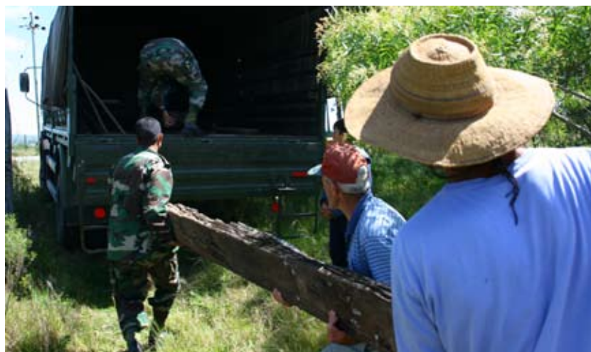
Rescatando materiales de las vías de tren para el monumento comunitario con el apoyo del ejército nacional y AFE. Zapicán, Lavalleja.