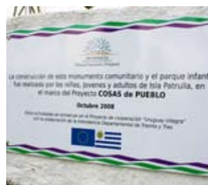
Izquierda: Inauguración monumento. Isla Patrulla, Treinta y Tres.