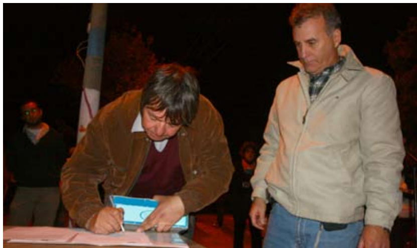
Entrega de fondos para la construcción del museo del oro.

Una vez culminada esta etapa, se sigue trabajando con el grupo de vecinos durante dos meses más para que la utilización de los insumos asuma un carácter colectivo.