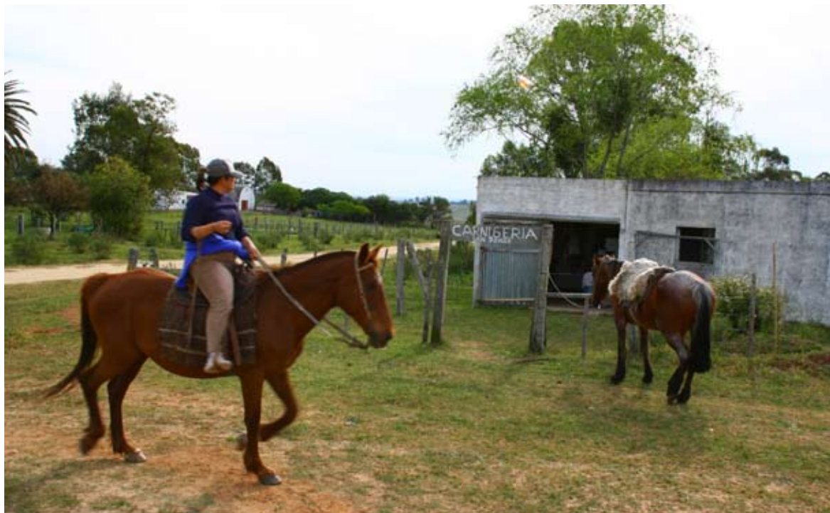
Calle de Isla Patrulla, Treinta y Tres.

zona es el “corazón” de la cuenca arrocera del departamento. Las oportunidades laborales se limitan a empleos rurales en arroceras, estancias, changadores, esquiladores, alambradores, monteadores, es decir trabajo zafral. Los servicios con que cuenta el poblado son escuela pública, OSE, UTE, ANTEL, juzgado de Paz, oficina de Correos y una policlínica con enfermero residente y visita semanal de un médico, cooperativa de mujeres tejedoras, Sociedad Tradicionalista Paso del Dragón, club social.