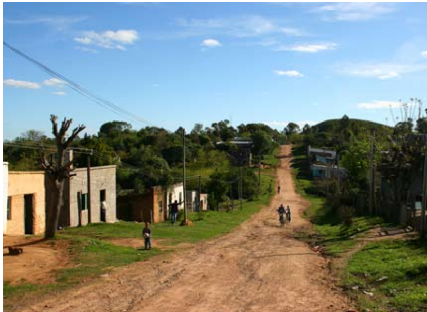
Escena de calle en Minas de Corrales. Rivera.