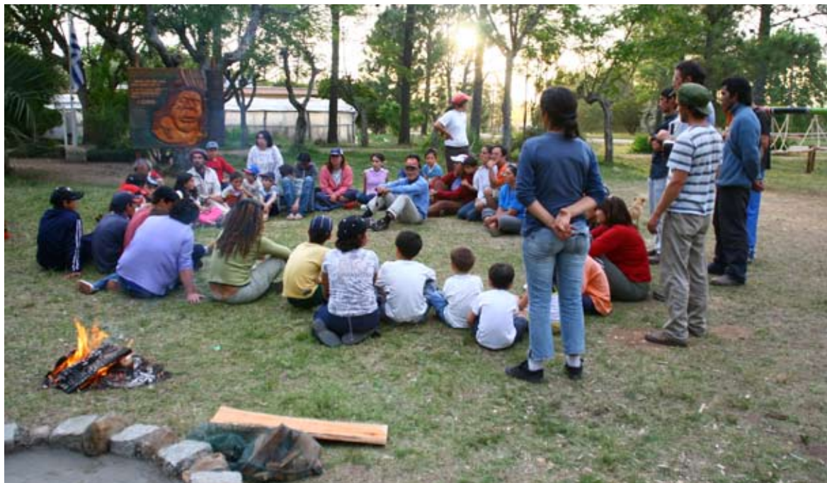
Círculo de reflexión sobre el proceso del trabajo comunitario en Zapicán, Lavalleja.

del fortalecimiento de la confianza y autoestima de sus participantes.