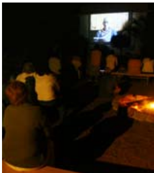
Izquierda: Proyección final del documental realizado por los pobladores. Zapicán, Lavalleja.