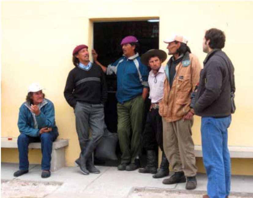
El equipo de Cosas de Pueblo entrevistando a los ciudadanos en la puerta del boliche en Grecco, Río Negro.

forestal, Valentines desarrolla emprendimientos productivos tales como el aserradero, el vivero y la minería.