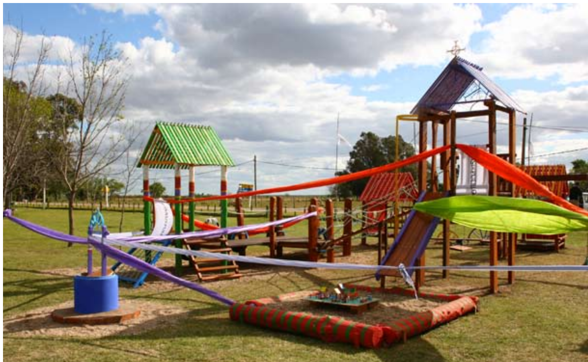
Monumento de Villa Soriano con la forma del pueblo en miniatura. Soriano.

Villa Soriano (Soriano). El lanzamiento oficial del proyecto se llevo a cabo el 28 de agosto de 2009.