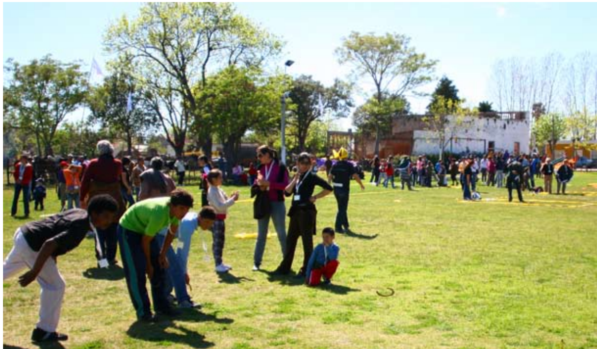
Feria de Juegos tradicionales.

En ese marco, el pueblo anfitrión demostró una actitud muy integradora, logrando una amplia convocatoria tanto en el proceso de construcción del monumento como durante la preparación del encuentro. La participación trascendió los grupos etarios, sociales, laborales y político partidarios; toda la comunidad aunó esfuerzos para recibir a los invitados y hacerlos sentir lo más a gusto posible, cerrando la experiencia con una despedida muy emotiva y generando una gran cohesión social y territorial.