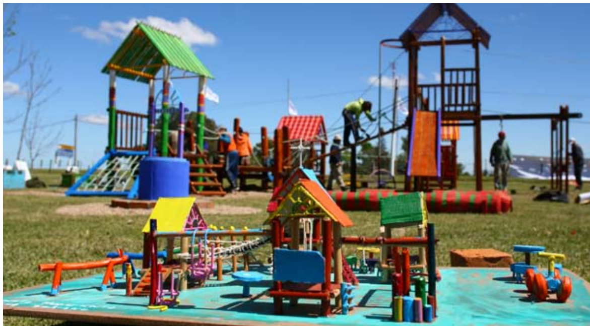
Maqueta y el monumento terminado en Villa Soriano, Soriano.

monumento. Para llegar a esa resolución la comunidad debe decidir cuál es el lugar más apropiado, respetando la condición de que debe ser un espacio público. En ese sentido, el sitio elegido representa un lugar de amplificación simbólica de la comunidad. Una vez elegido el sitio, se debe solicitar permiso a las autoridades correspondientes.