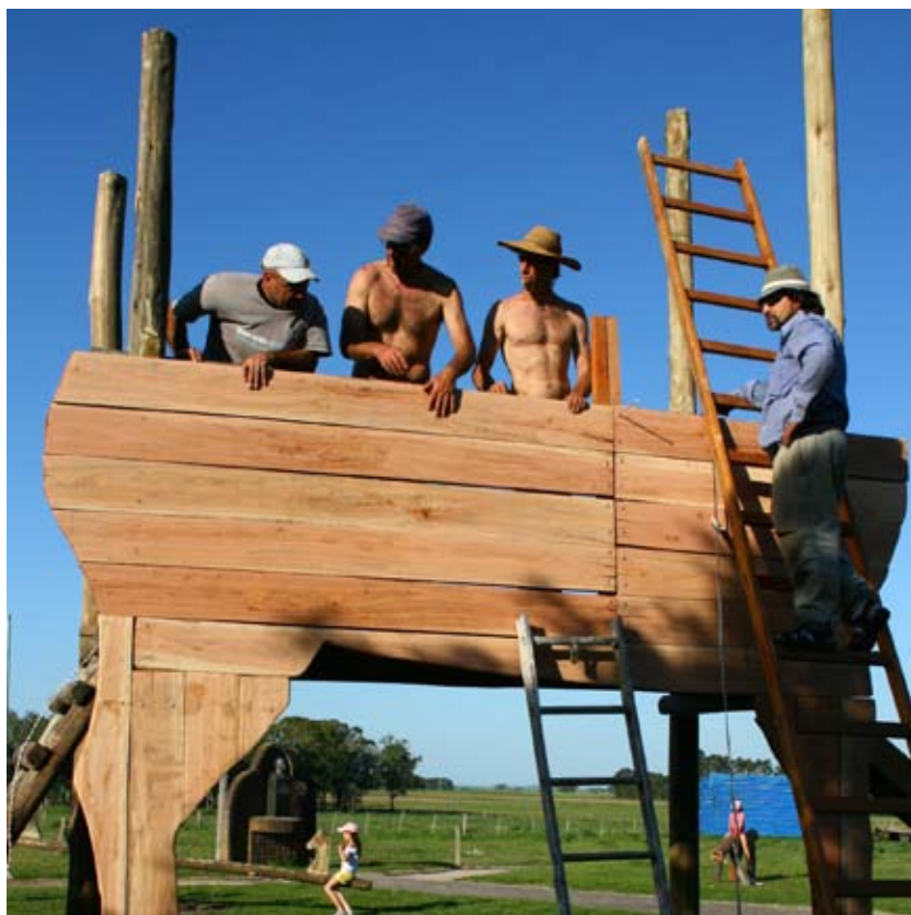
Contrucción del monuemento por los pobladores de Sarani Grande. Florida.

En relación al trabajo con la comunidad, se realizaron diversos talleres en la escuela y el liceo. El trabajo en la escuela se centró en base a murales que reflejaran elementos identitarios de Sarandí Grande, por ejemplo el caballo como signo de su identidad local. Sarandí Grande es uno de los principales puntos de Raid Federado (pruebas de resistencia de caballos) y