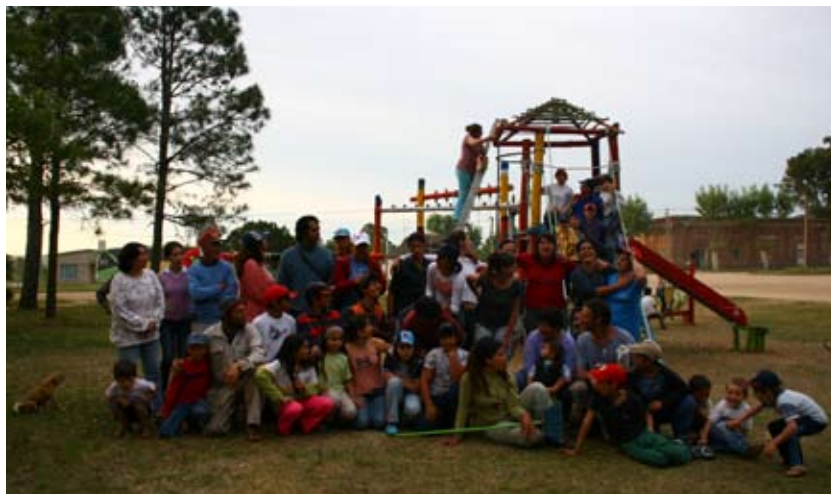
Pobladores al final de la construcción del monumento. Zapicán, Lavalleja.

Zapicán (Lavalleja). La fecha de inicio fue el 3 de octubre de 2008. Monumento Comunitario pensado y construido de manera colectiva, es una plaza temática donde se desarrollan tres elementos simbólicos del pueblo: un área charrúa, un fogón criollo y una casa de inmigrantes. De igual manera que en los pueblos anteriormente trabajados, los niños crearon un mural en las paredes de la escuela pública.