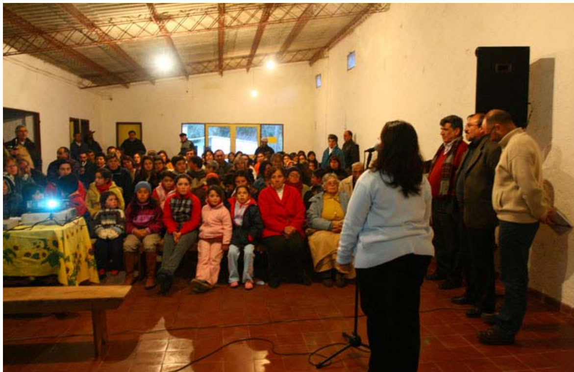
Lanzamiento Isla Patrulla, Treinta y Tres.

la presentación de las actividades del proyecto, hace hincapié en transmitir el placer de participar en lo que nos compete a todos.