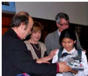
Izquierda: Entrega de premios del llamado a escuelas públicas de Cosas de Pueblo y la biblioteca nacional.