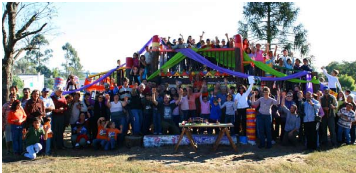
Retrato de todos los trabajadores del monuemnto. Villa Ansina, Tacuarembó.