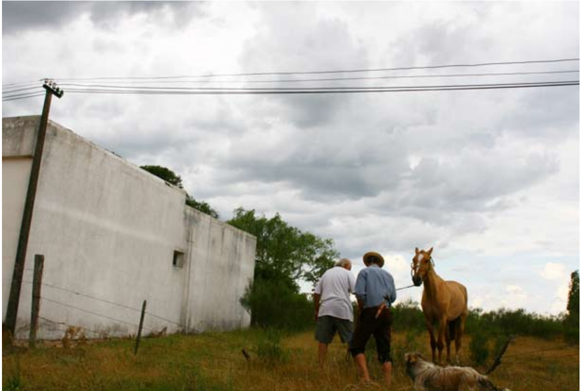
Tareas rurales en la calle principal de Valentines, Treinta y Tres, Florida.

Valentines. Ubicado en la 4ª Sección Censal del departamento de Florida y en la 6ª Sección Censal del departamento de Treinta y Tres.