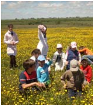
Investigando la naturaleza del pueblo.