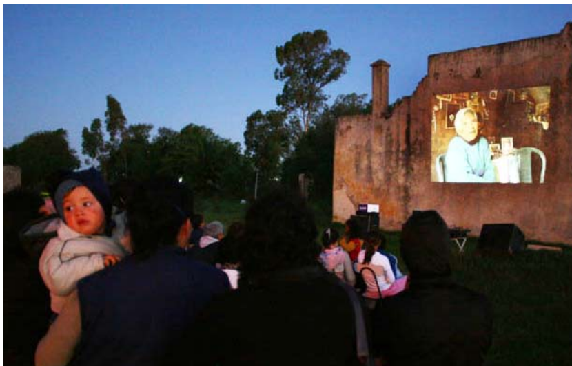
Video participativo Valentines. Treinta y tres, Florida.