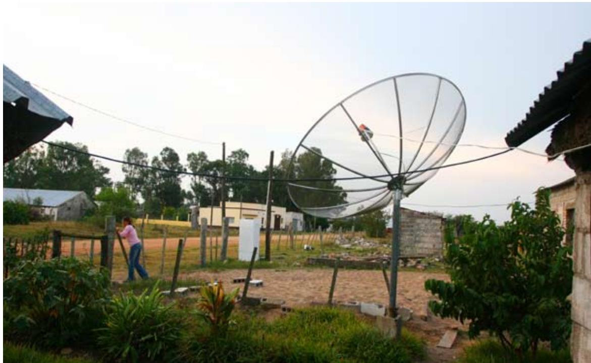
Casa del pueblo, Plácido Rosas, Cerro Largo.