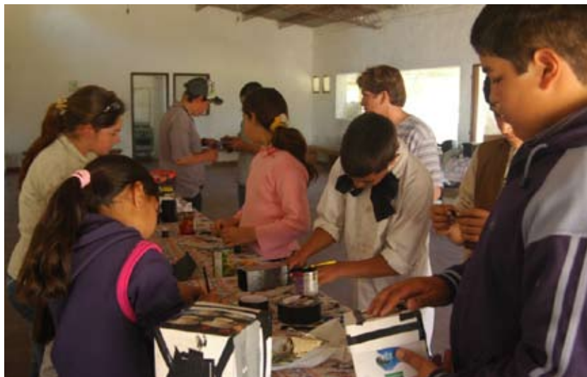
Fabricando cámaras estenopeicas con cajas y latas. Isla Patrulla, Treinta y Tres.

Isla Patrulla. Se llevó a cabo el taller de fotografía comunitaria que trabajó con un grupo de 20 personas, quienes participaron de manera activa durante los talleres, aprendiendo todo el proceso de la fotografía, orientado a partir del rescate de la identidad y tradiciones locales.