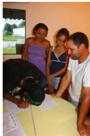
Firma del documento de la entrega de los fondos de identidad local.

Además, el proyecto incluye en su plan de acción la realización de encuentros anuales y regionales con intervención de la ciudadanía, gobierno nacional y gobiernos departamentales.