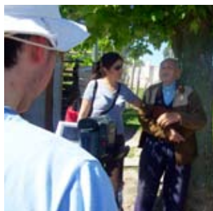
Izquierda: Entrevistas para registrar la historia del pueblo en el video participativo del Villa del Carmen, Durazno.