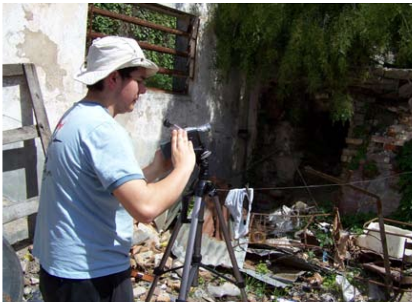
Filmando historias locales con la cámara de video que obtuvieron en el fondo de Villa del Carmen, Durazno.

Del mismo modo que en los pueblos anteriormente trabajados, en dicho pueblo se llevó a cabo un plan de seguimiento para fortalecer el trabajo comunitario y verificar que se cumplieran los requisitos del reglamento de utilización.