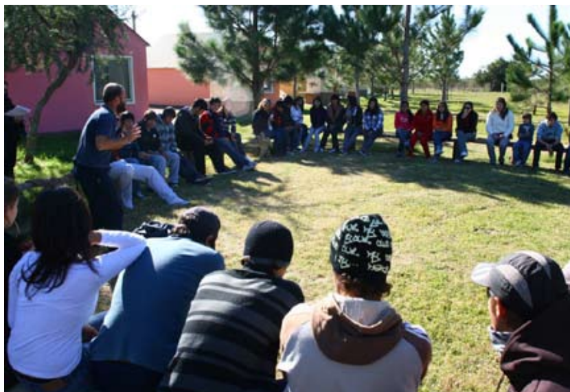
Dinámicas de grupo en el encuentro regional. Charqueada, Treinta y Tres.

Se considera que la formación otorga a los individuos mayores conocimientos sobre el funcionamiento del sistema político. En la medida en que la persona disponga de un grado de instrucción elevado, podrá entender el efecto de las decisiones políticas sobre su vida. Como