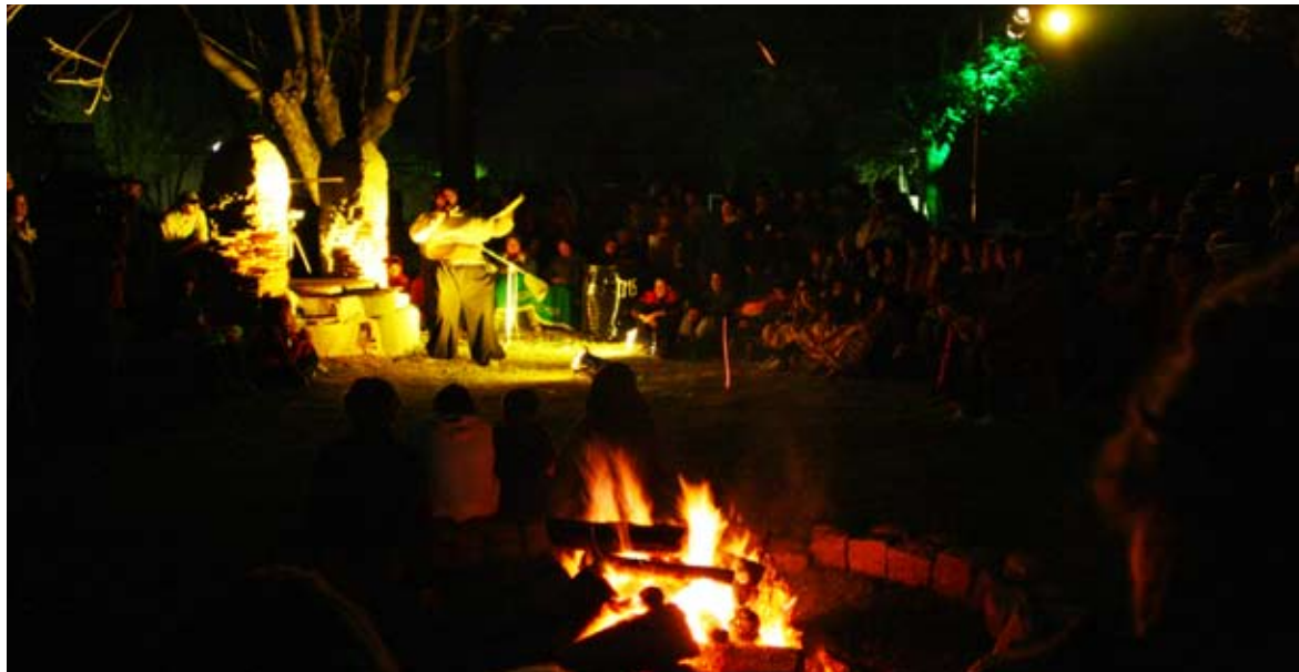
Fogón de los pueblos.

Por último, debieron pensar qué elementos querían llevar para ser depositados en la cápsula del tiempo que será abierta dentro de 20 años.