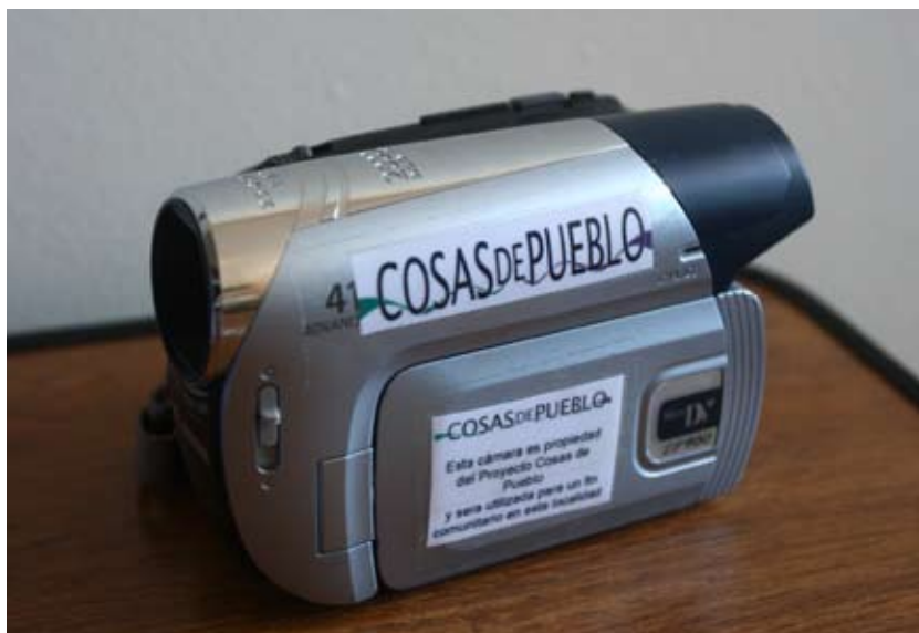
Cámara entregada al pueblo de Zapicán, Lavalleja.

Zapicán. El producto de los talleres de trabajo es una propuesta orientada a continuar el fomento del registro visual de todas las actividades de la localidad. En tal sentido, una vez presentada la propuesta avalada por instituciones locales y el compromiso de la comunidad, el proyecto apoyó el emprendimiento a través de la compra de una cámara de video.