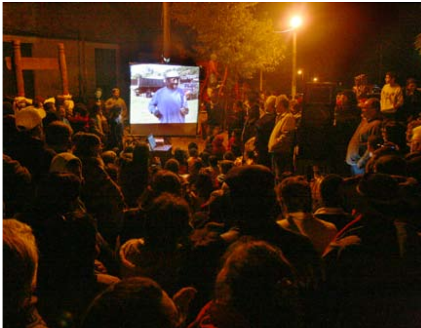
Presentación final del video en la plaza de Minas de Corrales, Rivera.

De esta manera, Voz de Pueblo busca asegurar que tanto la expresión como la creatividad sean formas de manifestar la existencia de un sujeto humano, ya que a través de ella se revelan las necesidades de crecimiento. La relación entre sujeto y objeto creativo encierra un proceso de descubrimientos, al incorporar componentes y atributos necesarios para elaborarlo, constituyendo una auténtica creación de significados que es esencial y subjetiva.