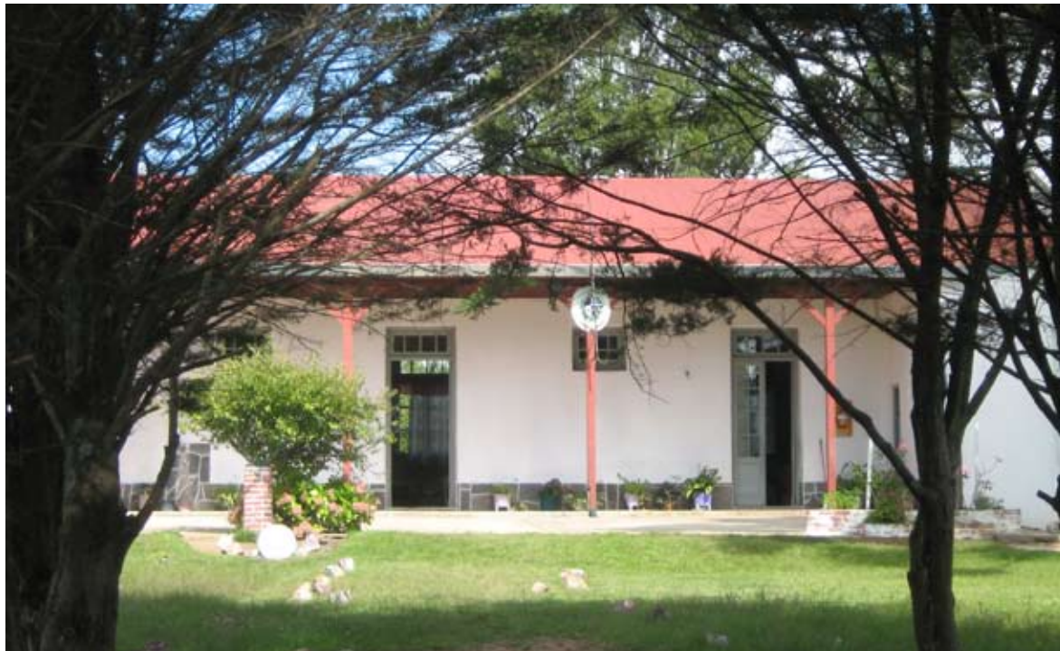
Escuela pública de Valentines.