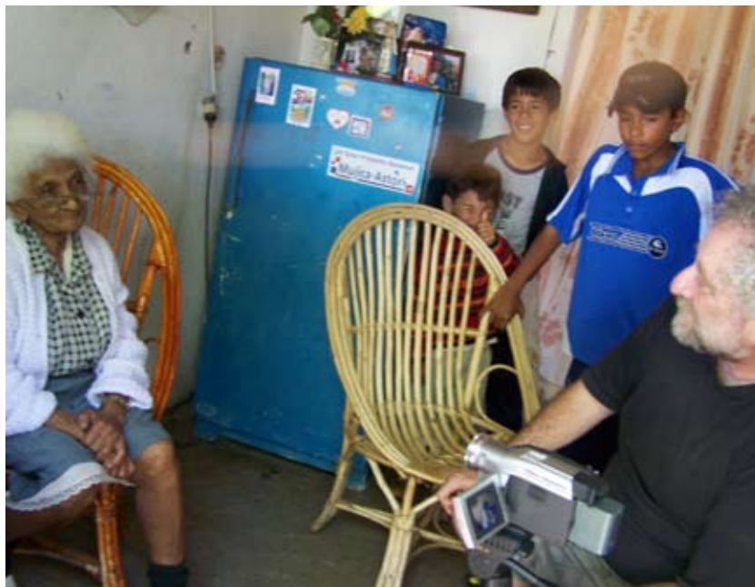
Derecha: Entrevistas con los conocedores de la historia del Villa Ansina.

Villa Ansina. El taller de video comunitario, que tuvo una duración de tres meses, se desarrolló principalmente con el Grupo de la Tercera Edad. Participaron 15 personas y el resultado fue un video producto de la creación colectiva, donde se rescatan aquellos elementos tradicionales e identitarios de Villa Ansina percibidos por el grupo. La presentación del corto se realizó el 25 de abril del 2010; al mismo tiempo se entregaron los certificados a las personas participantes del taller. Fue una actividad dentro de la agenda festiva que se realizó en el Monumento Comunitario acompañando también el cierre del producto de la línea de Orgullo Local.