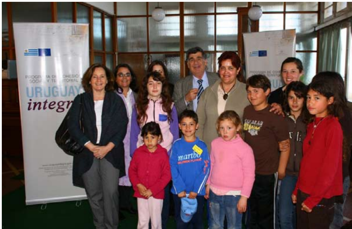
Entrega del premio de Cosas de Pueblo a la escuela de la Boyada, San José.

Se realiza mediante un llamado abierto a escuelas públicas de localidades menores de 3.000 habitantes, en todo el territorio nacional, en coordinación con la ANEP y con la colaboración de la Administración Nacional de Combustibles, Alcohol y Portland (ANCAP) y del Ministerio de Defensa Nacional.