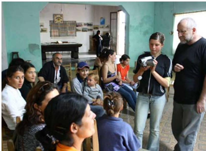
Derecha: Aprendiendo a filmar y a realizar entrevistas. Zapicán, Lavalleja.

Zapicán. A diferencia de los dos pueblos anteriores, en esta localidad se llevo a cabo el primer taller de video comunitario. El eje temático del mismo es la historia del pueblo contada por distintos referentes sociales, tales como el médico, vecinas que construyen viviendas del Plan MEVIR, etc. Es muy relevante destacar el hecho de que mayoritariamente participaron jóvenes en la confección del guión y armado del video.