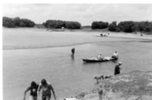
Izquierda: Fotografía resultado del taller de fotografía. Plácido Rosas, Cerro Largo.