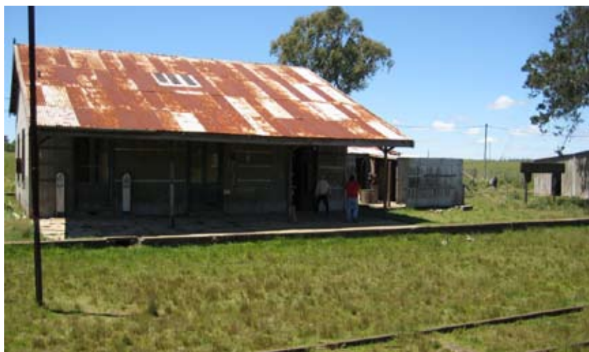
Antigua estación de tren. Valentines, Treinta y Tres, Florida.