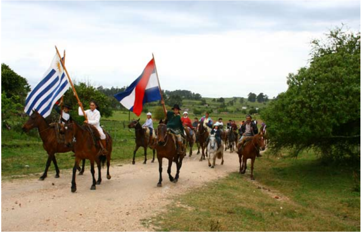
Caballería gaucha en Isla Patrulla.