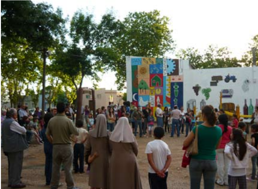
Fiesta de inauguración del monumento en Villa del Carmen, Durazno.

Con esos dibujos los talleres continuaron con los alumnos del liceo, quienes prepararon en una jornada la maqueta final del juego a construirse, aportando sus identidades a los dibujos hechos en la escuela. En esta instancia resaltamos el fuerte compromiso y participación del artista local, que enriqueció los talleres de pintura y maquetas del monumento.