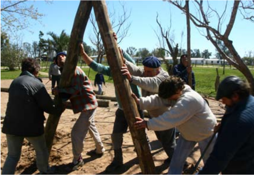
Construcción del monumento comunitario por los pobladores.