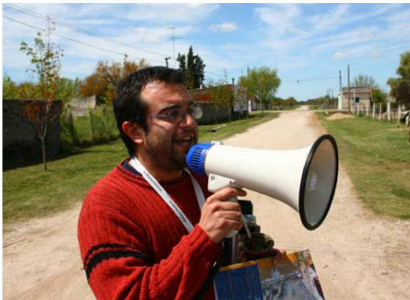
Invitación a las actividades de cosas de pueblo mediante una comunicación sencilla y directa.

La acumulación de buenas prácticas constata que el desarrollo de este tipo de experiencias participativas necesariamente implica una dispersión del poder. Asimismo, evidencia que como consecuencia de ello el proceso de toma de decisiones adopta una lógica distinta. En una organización centralizada el proceso decisorio se lleva adelante mediante una lógica sectorial-vertical. En cambio, bajo un modelo descentralizado el proceso decisorio asume una lógica horizontal-