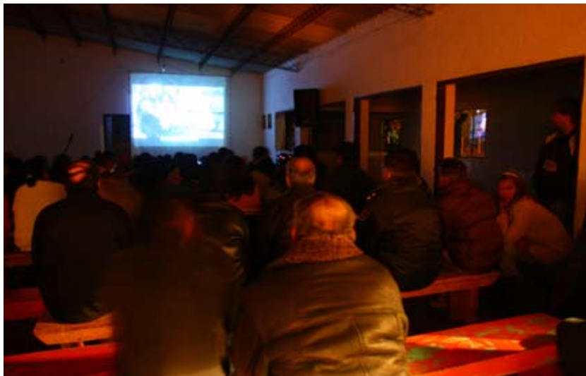
Proyección de cine al final de un lanzamiento.

reconociendo que el proceso de participación estará compuesto de actores con valores, intereses y dinámicas de trabajo distintas que probablemente provoquen problemas de coordinación y puedan terminar bloqueando los procesos participativos.