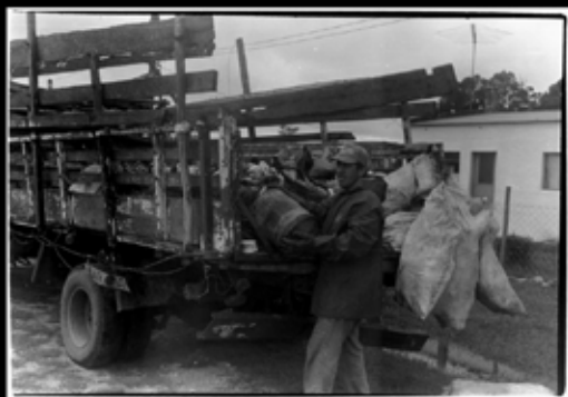
El popular Carlitos, recolectando basura en su camión llamado "Sobresaliente". Cristian Oyambure. Isla Patrulla, diciembre 2008. Foto blanco y negro, 20 x 25 cm.