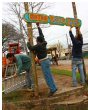
Izquierda: Colocando carteles con mensajes que aportaron los participantes.