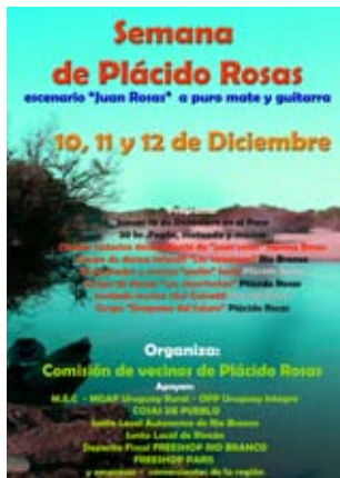
Izquierda: Afiche la semana de Plácido Rosas 2009.