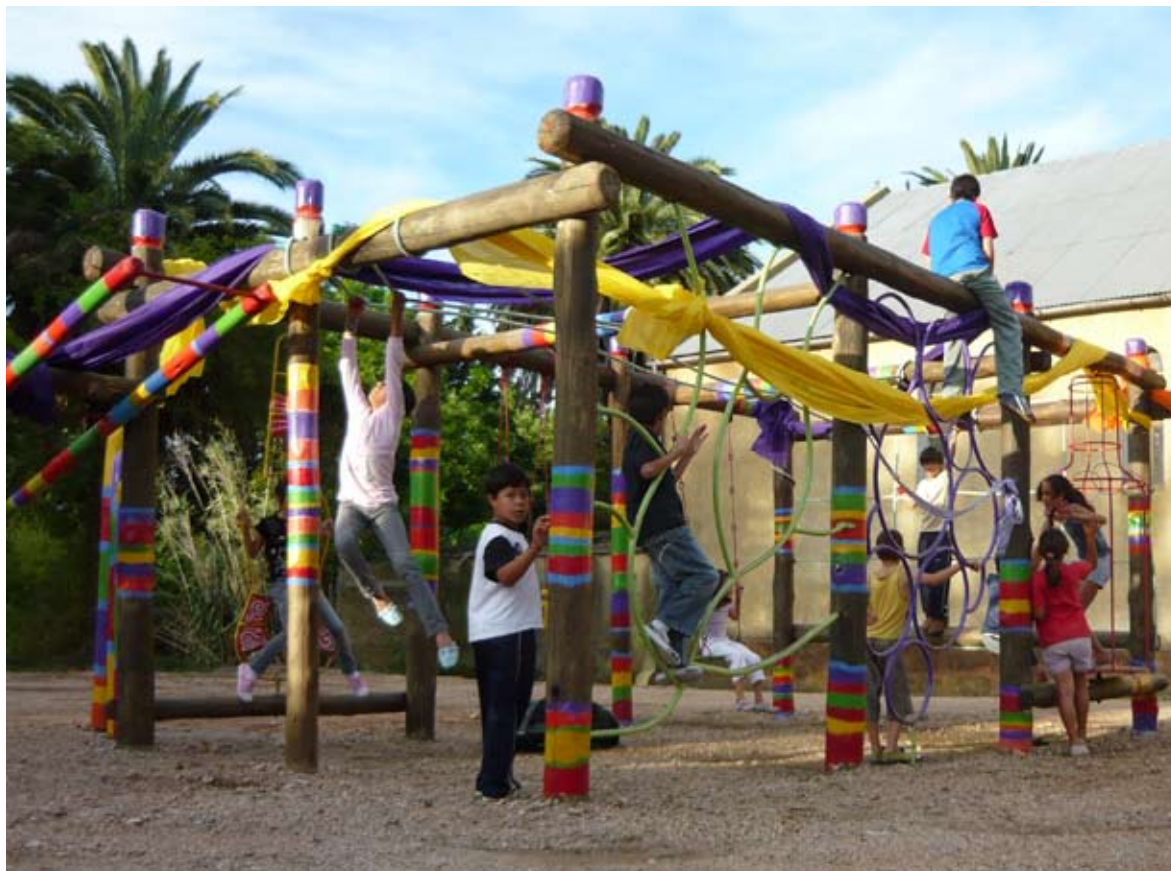
Monuemnto comunitario. Villa del Carmen, Durazno.

Villa del Carmen (Durazno). Fecha de lanzamiento: 11 de setiembre de 2009. En cuanto al trabajo con la comunidad, se dio en talleres con la escuela y el liceo. En la escuela se trabajó en base a murales que reflejaran elementos identitarios de Villa del Carmen, por ejemplo la vitivinicultura y la producción de pan. Cabe destacar que esta comunidad tiene arraigada fuertemente a nivel identitario la noción de “Pueblo del mejor pan y el mejor vino”.