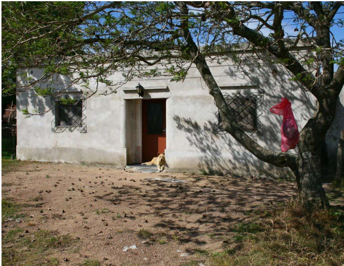
Casa de Villa del Carmen, Durazno.