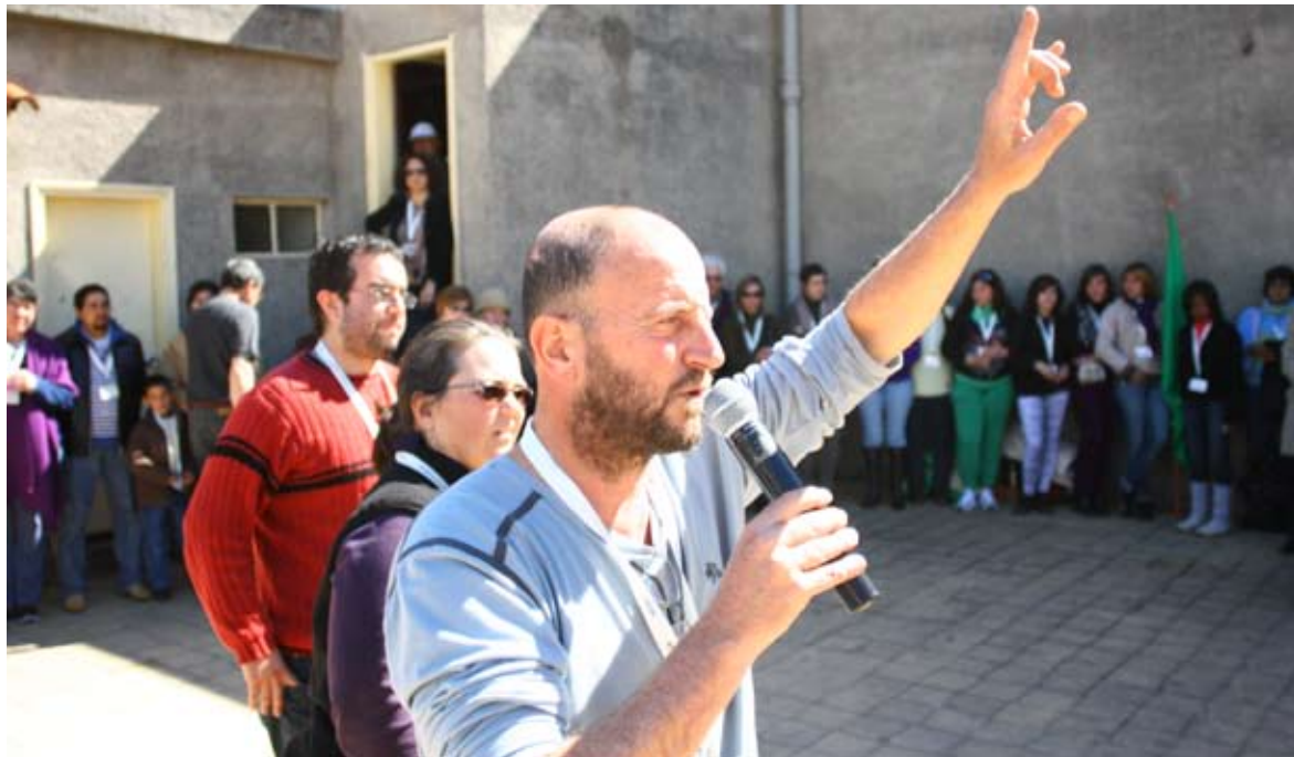
Trabajadores de campo del proyecto Cosas de Pueblo en plena actividad en Villa Soriano.

estratégicas una vez que los equipos abandonaron el territorio, acompañando y orientando la ejecución del proyecto en la comunidad día a día. De tal manera, se intensificaron los lazos basados en la confianza tanto a nivel de la población, como entre la comunidad y el proyecto. Este logro fue producto de un intenso trabajo de reforzamiento de los vínculos interpersonales a través de la aplicación de diferentes herramientas de socialización y participación. Su riguroso seguimiento en los pueblos impactó positivamente tanto en el desarrollo como en los resultados de los encuentros –regional y nacional–, ya que su interacción logró permear la vida cotidiana de la comunidad.