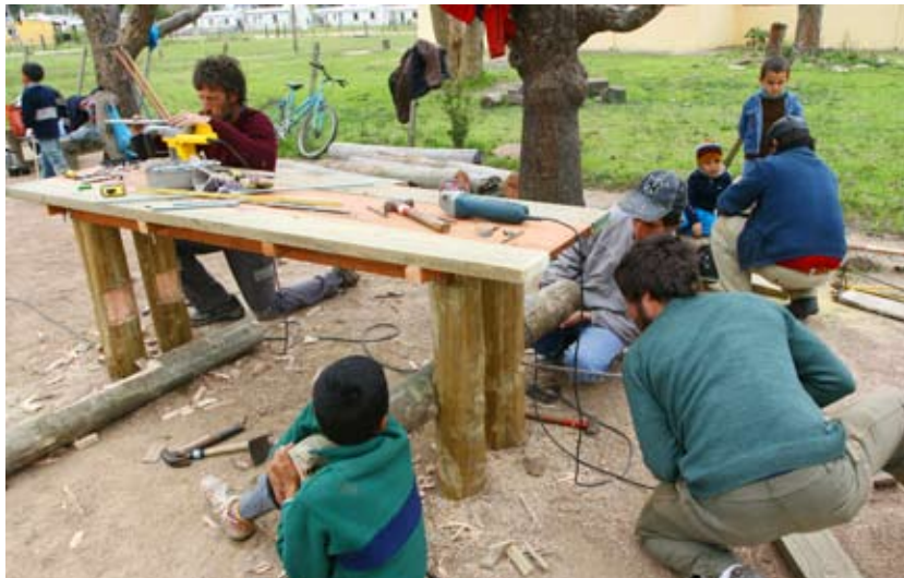
Derecha: Construcción de una mesa anexa al monuemnto en Placido Rosas, Cerro Largo.

los talleres de discusión, en cambio hay quienes eligen colaborar de diversas formas durante la construcción del monumento.