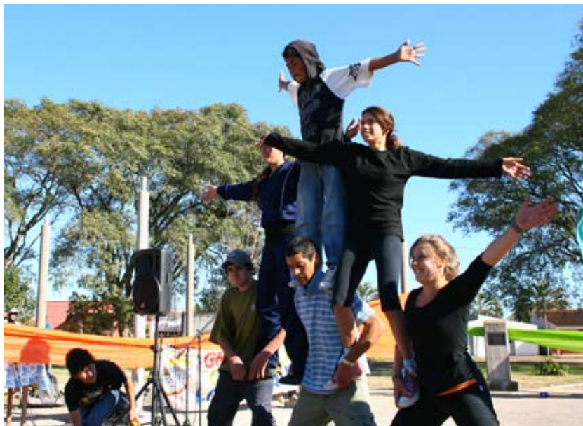
Proyecto de Circo con Jóvenes de Maldonado Nuevo – Maldonado.

interacciones, se va a realizar la Fiesta del 1.º de Mayo donde se juntan todas las personas nacidas en Villa del Carmen; en ese sentido se les extendió la invitación a la población de Villa Soriano para participar del evento.