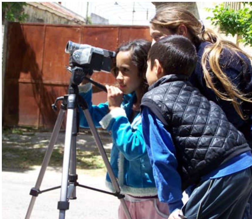
Derecha: Jovenes aprendiendo a filmar en Villa del Carmen, Durazno.

Villa del Carmen. Al igual que en Sarandí Grande, Voz de Pueblo fue la primera línea estratégica desarrollada en la localidad; se altera la metodología para llegar en tiempo y forma al encuentro nacional. El taller de video comunitario tuvo una duración de tres meses y se desarrolló principalmente con el grupo ya conformado para el Encuentro Nacional.