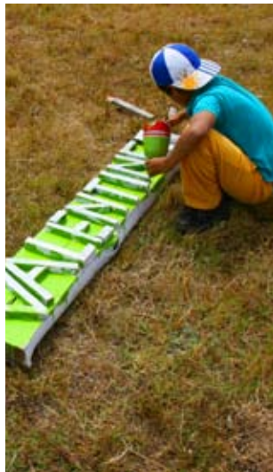
Izquierda: Pintando el cartel del nuevo monuemnto con forma de Tren.