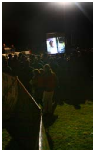
Izquierda: Proyección final al aire libre para todo el pueblo. Villa Ansina.