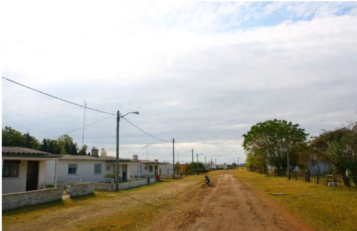
Barrio Mevir en Sarandí de Navarro, Río Negro.

reuniera las condiciones fijadas en la tipología; asimismo se debió ajustar el calendario de lanzamientos en los demás pueblos e iniciar la retirada de Cebollatí, luego de explicar a las autoridades departamentales y a la comunidad las razones que no justificaban la presencia del proyecto en el pueblo en ese momento.